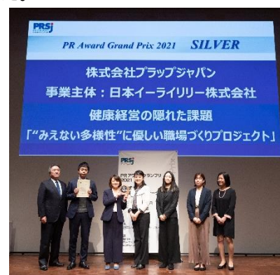
授賞式の様子 (12月14日 東京都内にて)

受賞ページ : https://prsj.or.jp/2021/12/07/release_prawrd2021/