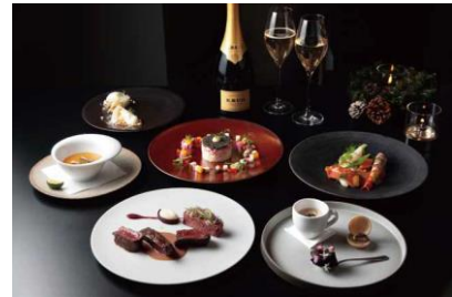
クリスマススペシャルディナーコース (全 6 品) ¥13,000/¥15,500