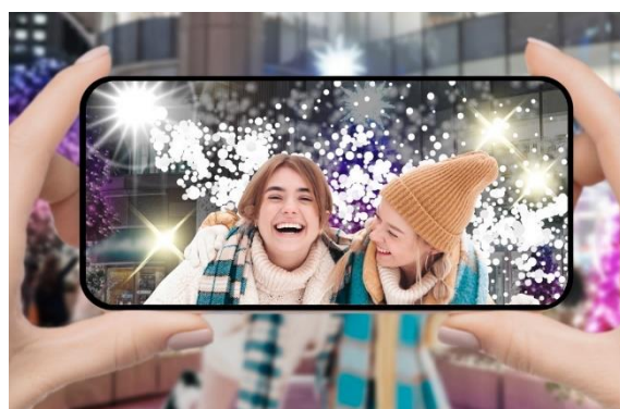
AR フィルター イメージ

東京ミッドタウン日比谷 イルミネーション特設サイト URL https://www.hibiya.tokyo-midtown.com/xmas/