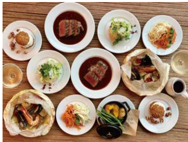
クリスマスコース 2021 ¥7,700

どこか懐かしい伝統的なメニューを好きな時に楽しめる“街の食堂”として人気の「Buvette」。今回はクラシカルな料理が並ぶクリスマスコース料理が登場します。テラス席からはイルミネーションを眺めながらお食事ができます。