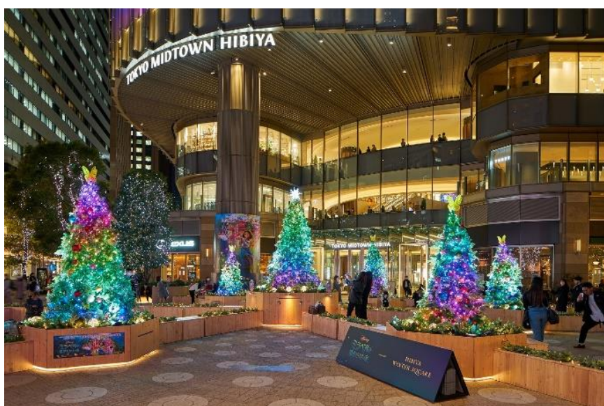
日比谷ステップ広場「HIBIYA WINTER SQUARE」特別演出イメージ

実施期間：12月26日(日)まで 演出時間：初回演出 17時～／最終演出 22:40～ ※毎時 00分、20分、40分 演出楽曲：Tomorrow ～ ORIGINAL MOTION PICTURE SOUNDTRACK～