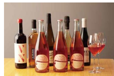
ロザ・ロゼ・ロザム (フランス ロワール産 (ロゼ泡)) グラス：¥1,200/ボトル¥6,000

フランスを代表するワイン誌で星を獲得した、貴重なナチュラルワイン。苺のようなチャーミングな香りながら、味わいはドライで野菜料理との相性も抜群。日比谷ステップ広場や階段のイルミネーションを眺めながら、限定ワインをお楽しみください。