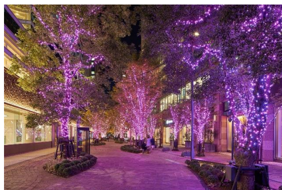
日比谷仲通りの様子 2021

実施期間：2022年2月14日（月）まで 点灯時間：17：00～23：00 場 所：日比谷仲通り／東京ミッドタウン日比谷 主 催：一般社団法人日比谷エリアマネジメント／ 東京ミッドタウン日比谷