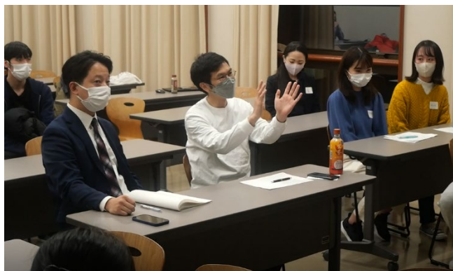
3 日目：学習院大学でのワークショップの様子