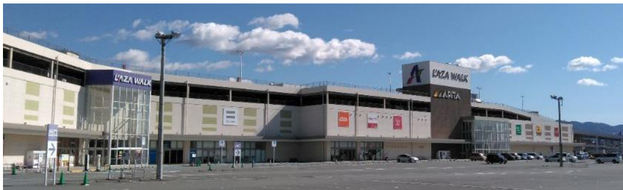
「ラザウォーク甲斐双葉」外観