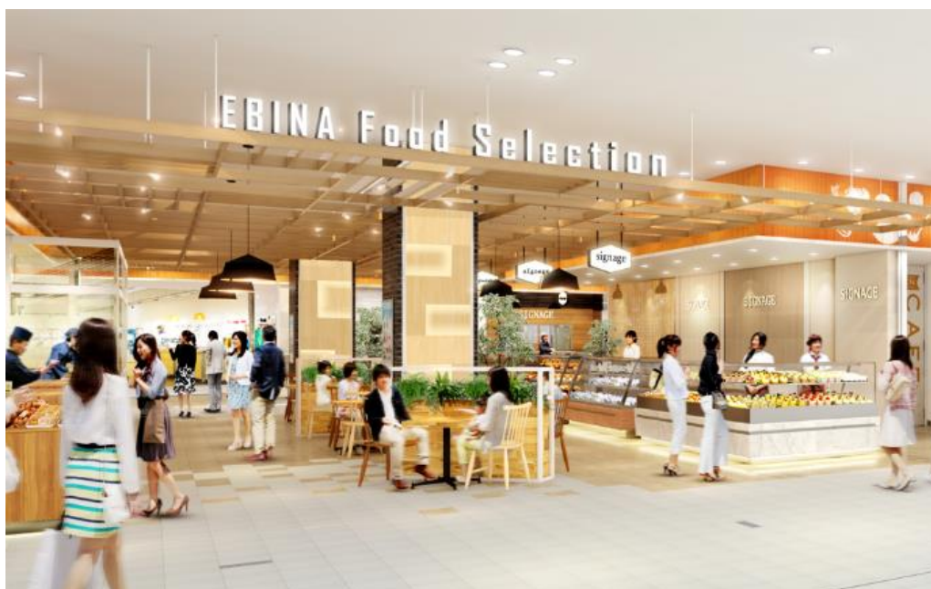
<EBINA FOOD SELECTION パース>

ららぽーと海老名は、本リニューアルを通じてお客さまの多様なニーズに応え、日常使いに適した店舗を拡充するほか、お客様が思い思いの時間を安心して楽しく過ごしていただける空間へと進化いたします。