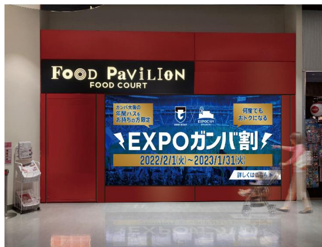
<フードコート内大型デジタルサイネージ イメージ>