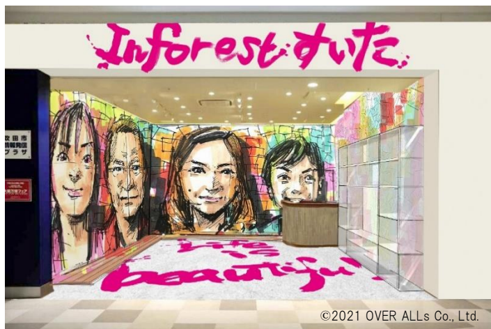
<inforest すいた リニューアル後店舗 イメージ>

多数のメディアにも出演実績のある株式会社 OVER ALLs(所在:東京都世田谷区、代表:赤澤岳人)による内装アートが目を引く非日常的な空間から、当館を訪問いただく皆さまにこのまちの魅力を発信します。