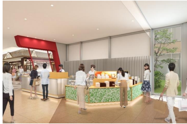
<イベントスペース パース画像>

観覧車・EXPO KITCHEN から続く本館入口付近(オレンジサイド 1 階)にイベントスペースを新設いたします。話題のスイーツやフード・人気の雑貨アイテムなどの期間限定ポップアップショップを展開し、ご来館いただくお客さまに折々の旬の魅力をお届けします。