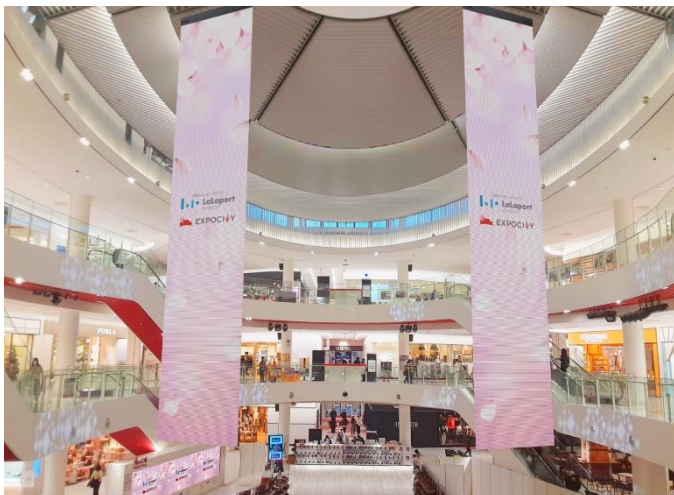
<「光の広場」大型デジタル懸垂幕 イメージ>

また、フードコート内大型デジタルサイネージでは、万博記念公園やガンバ大阪等の周辺エリア情報や産官学連携の取り組みを中心に紹介します。