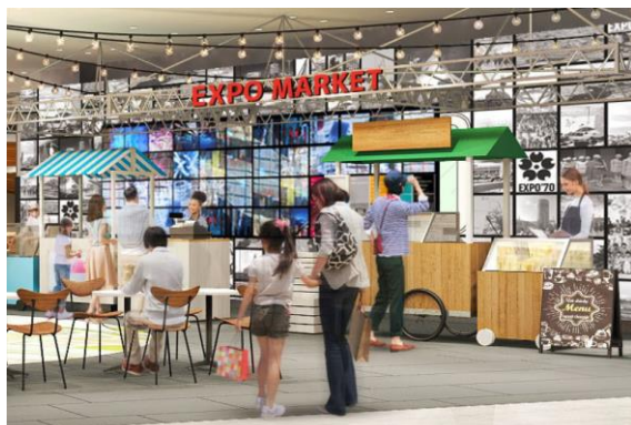
<「EXPO MARKET」 パース画像>