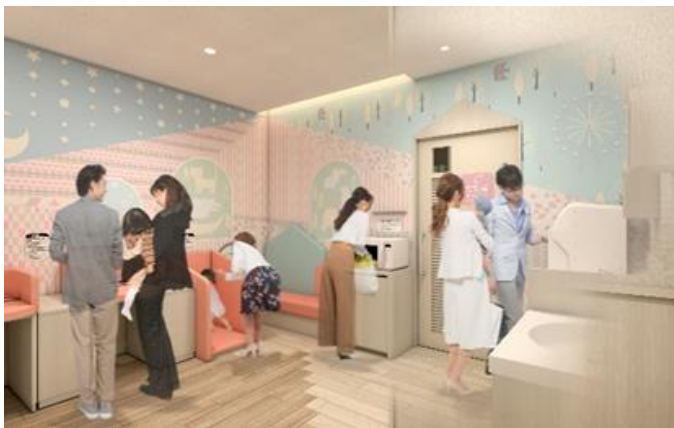
<ベビー休憩室 パース画像>

子育て世代のママ・パパの利便性・快適性を高めるよう、「ベビー休憩室」を改修します。お子さまにミルクを飲ませたり離乳食を食べさせたりしやすいよう、おむつ替えエリアにソファを設置しました。また、授乳個室のソファも従来より大きいサイズのものに変更し、内装も子ども部屋をイメージした空間に刷新しました。