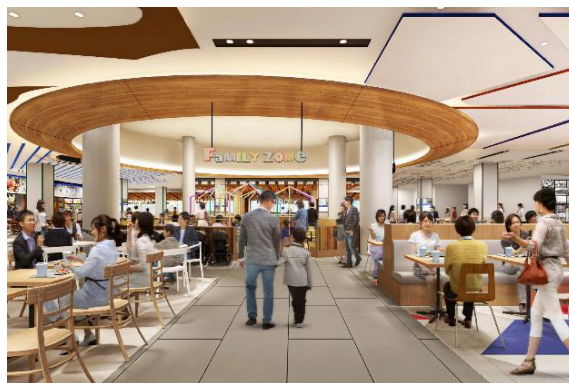
<「FAMILY ZONE」 パース画像>