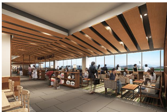
<「LA LA LOUNGE」・「PREMIUM LOUNGE」 パース画像>