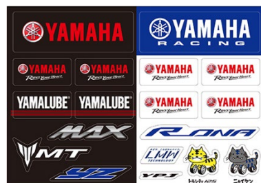
YAMAHA ステッカー（A5 サイズ）

応募方法は、「My YAMAHA Motor Web」のキャンペーンサイトからエントリーするだけです。また、キャンペーン対象のイベントにご来場いただくと1イベントにつき1応募口数を増やすことが可能です。イベント会場内ヤマハブースに設置してある「キャンペーンコード」を入力して応募ください。なお、当選者の発表は景品の発送をもって代えさせていただきます。