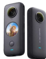
Insta360 ONE X2 5.7Kの超高解像のアクションカメラ