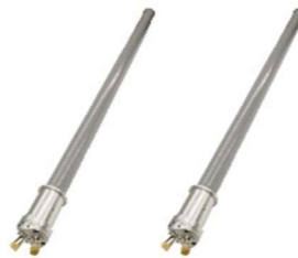
無指向性アンテナ (一部例)