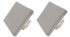
指向性アンテナ (一部例)