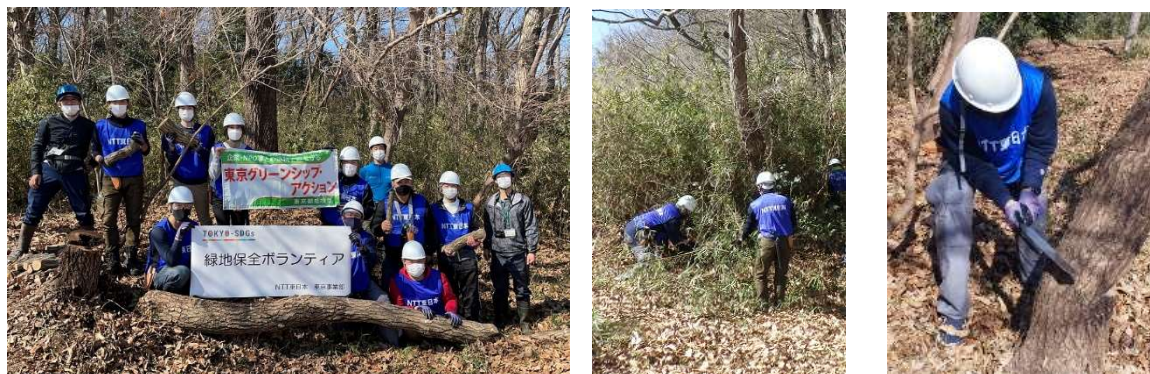
ボランティア活動する弊社従業員の様子

里山林を若返らせるため、継続して下草刈り、大きく育ち過ぎた木の伐採及び植林等を行い、里山の持っている多様な価値や機能を回復し、かけがえのない自然環境を守っていきたくと考えています。