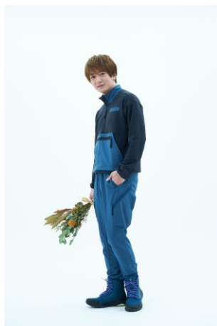
adidas Brand Center (South1・2F)

Instagram : https://www.instagram.com/kurodamayukaxx/