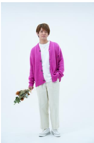
CONVERSE TOKYO (South2F)