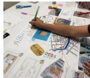
「日本橋探求キット」

Work-Life Bridge の活動の詳細については、こちらをご参照ください。