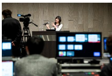
「コロナに負けない。生産性の高い働き方とは」 オンデマンドセミナー