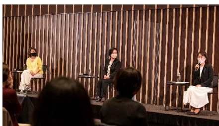
「女性のエンパワメントと多様性を考える」 トークディスカッション

毎年3月の国際女性デーに合わせて著名な講師をお招きし、「女性のキャリア&ダイバーシティ」に関するセミナーを開催しています。働く女性が直面する課題について考える機会や、相談の場を提供することで、多様な働き方の実現をサポートします。なお、本セミナーは昨年よりコロナ禍のため、オンデマンドで開催しています。