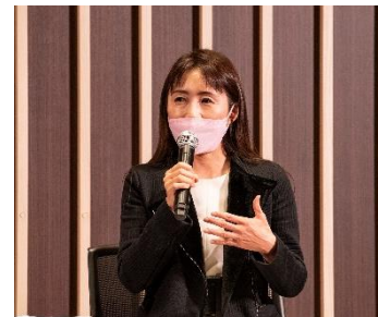
「女性のエンパワメントと多様性を考える」トークディスカッション