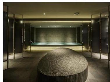
sequence KYOTO GOJO (THE BATH & THE SAUNA)

ブランドサイト: https://www.sequencehotels.com/