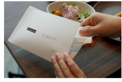
レストラン店内ではマスクケースをご用意