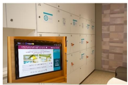
大浴場の利用制限と客室のテレビモニターで利用状況の確認