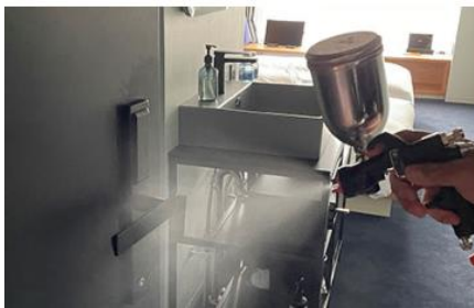
客室内の消毒と抗菌対策の徹底