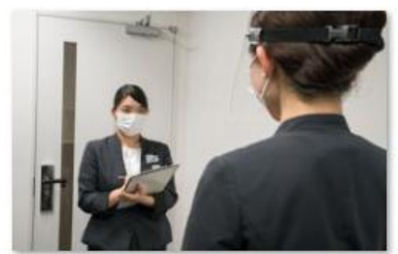
スタッフの体調管理の徹底