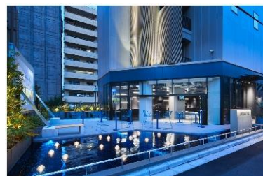
sequence SUIDOBASHI (外観・オープンテラス)