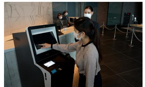
自動チェックイン機導入による接触軽減