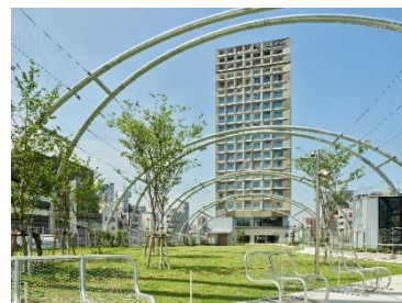
sequence MIYASHITA PARK (外観)

所在地 : 東京都渋谷区神宮前6-20-10 MIYASHITA PARK North 客室数 : 240室