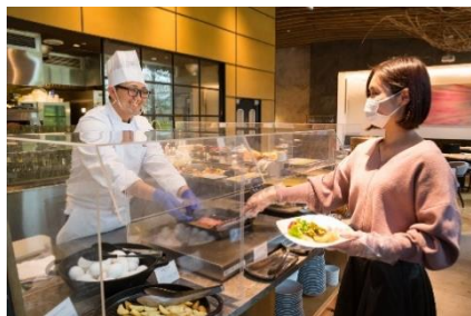
レストラン店内のアクリルボード設置とマスク・手袋着用の徹底(ビュッフェ)