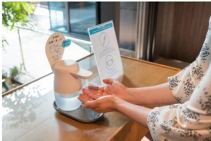
入館、館内施設利用時の検温と消毒