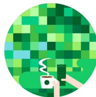
みんなでつくるミドリのプラネット

※6:「みんなでつくるミドリのプラネット」は、スターバックスのブランドサイト内からもご覧いただけます。