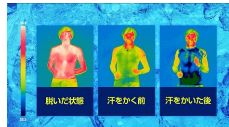
※運動をしている最中の検証結果