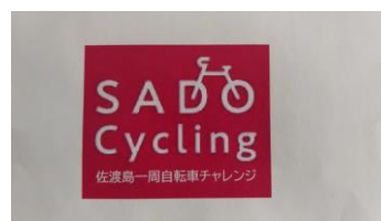
↑ 認定シール 3 × 3 センチメートル