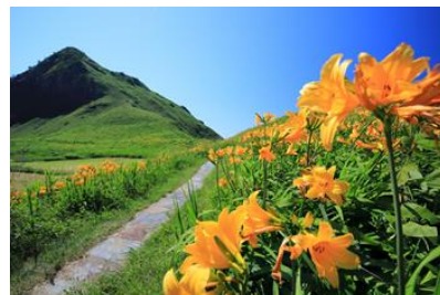
大野亀のカンゾウ