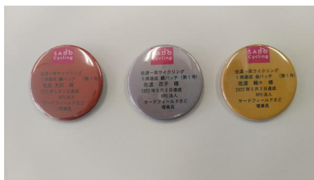
↑ 一周認定缶バッジ (1 周銅バッジ、5 周銀バッジ、10 周金バッジ) 直径 4 4 mm