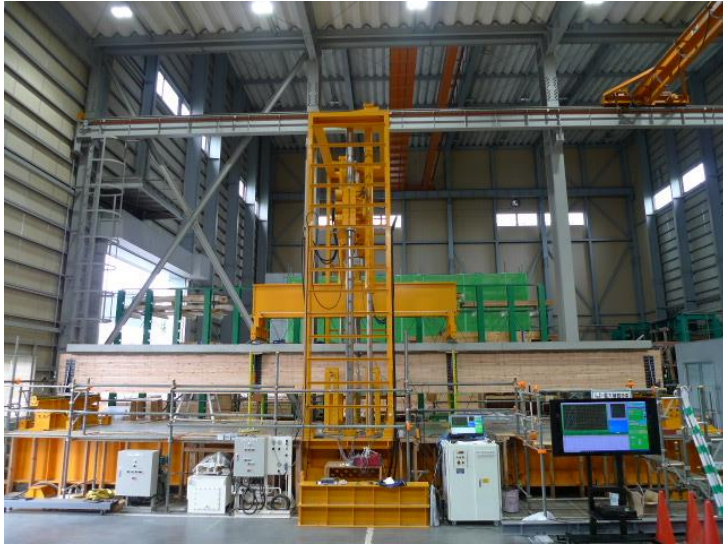
図 12m スパンの実大曲げ試験の様子

住友林業の「木ぐるみ」シリーズ ※4 をはじめとする耐火構造の木質梁に本構法を適用することも可能です。「合成梁構法」は木質構造でハードルの高い高層建築はじめ、建物の構造の種別や高さ、階数を問わず活用できます。