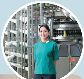
株式会社ウメダニット