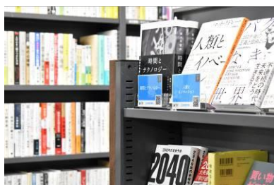
ライブラリー内観