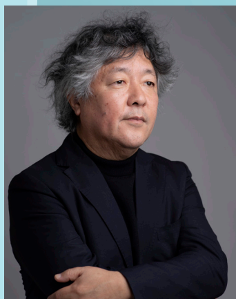
モギ ケンイチロウ 茂木 健一郎 氏

脳科学者。1962年東京生まれ。ソニーコ ンピュータサイエンス研究所上級研究 員。東京大学大学院委員教授。東京大 学理学部、法学部卒業後、東京大学大 学院理学系研究科物理学専攻課程 修了、理学博士。理化学研究所、ケンブ リッジ大学を経て、現職。脳活動から の意識の起源の究明に取り組む。