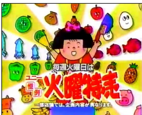
当時のテレビCMイメージ

1993～2008年まで愛知・三重・岐阜のテレビCMやラジオCMで16年間流れ、東海エリアの40代以上のお客さまの記憶に残り続けるとともに、20～30代にとっては子どものころに見た覚えがあるキャラクター「おトクちゃん」を復活させ、ポスター・POP・動画などの店内販促物でにぎやかにアピタ・ピアゴの“オトク”をお知らせします。