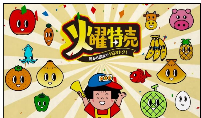
14年ぶりに復活した「おトクちゃん」

また、チラシ・LINE・ユニーHP※にも登場し、ニューファミリー層への認知を強化するとともに、「昭和・平成レトロ」がブームのZ世代にも、ノスタルジックな雰囲気を持つ「おトクちゃん」に興味をもってもらうことで、次世代消費者のアピタ・ピアゴファン拡大を狙います。