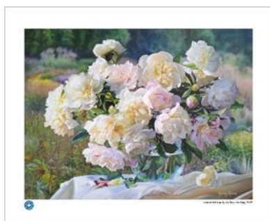
コパーニア（ポーランド）の作品