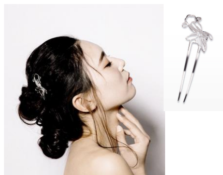
店舗：meta mate 誠品生活日本橋店 名称：KANZASHI「金魚すくい」 出目金 価格：13,200円 (税込)