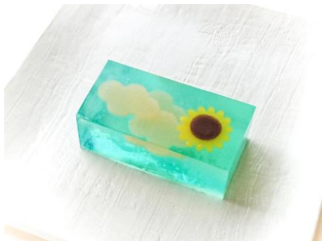
店舗：甘春堂本舗 名称：夏の庭 価格：422円 (税込)

今年は、“夏”をテーマにしたフォトジェニックなオリジナルスイーツ、フード、ドリンク、グッズを販売。昨年度開催の約3倍となる日本橋エリアの約160店舗もの老舗企業や百貨店、高級ホテルが浴衣でおさんぼを楽しむシーンにぴったりなメニューを提供します。