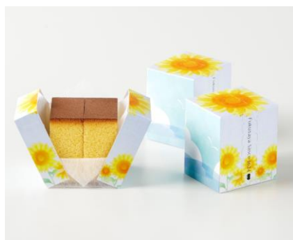
店舗：福砂屋 名称：フクサヤキューブ ひまわりパッケージ 価格：270円 (税込)