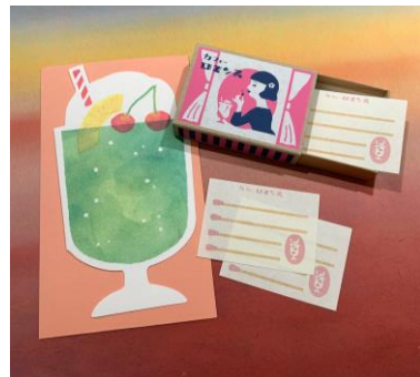
店舗：小津和紙 名称：ひんやり夏のメッセージ 和紙レターセット 他 価格：396円～ (税込)