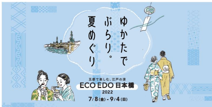
ECO EDO 日本橋 2022 キービジュアル

今年のテーマは「ゆかたでぶらり。夏めぐり」です。「日本の夏」や「江戸の涼」があちらこちらに散りばめられた日本橋で、浴衣を着て街歩きを楽しみませんか。