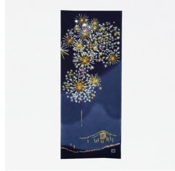
店舗：注染手ぬぐいにじゆら 日本橋店 名称：手ぬぐい 夏の夜 価格：1,760円 (税込)