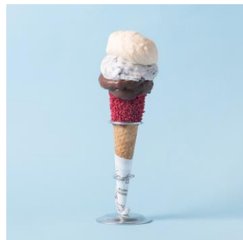
店舗：ヴェンキ 名称：レゴラーレ グルメコーン トッピング (Mサイズ) 価格：1,080円 (税込)