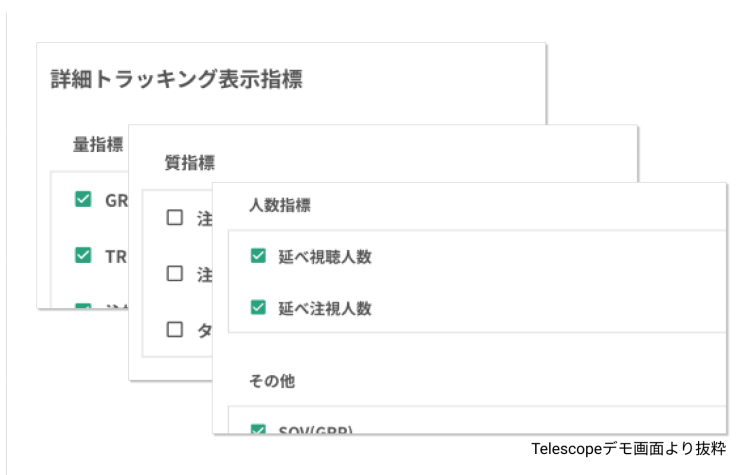
Telescopeデモ画面より抜粋