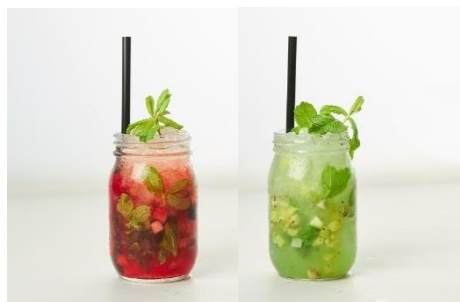
(左)甘酸っぱいベリーベリーモヒート 869円 (右)さわやかキウイモヒート 869円 [Mr.FARMER/B1]