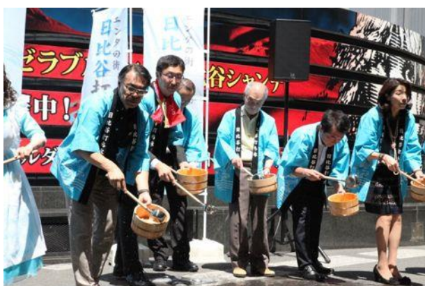
過去の打ち水の様子

参加企業・施設等：今治造船、鹿島建設、シアタークリエ、帝国ホテル 東京、東京都公園協会、東京宝塚劇場、東京ミッドタウン日比谷、日生劇場、日本生命、一般社団法人 日比谷エリアマネジメント、日比谷公園大音楽堂、日比谷シャンテ、日比谷商店会、日比谷図書文化館、三井不動産、レム日比谷 以上16企業・施設(五十音順、敬称略)