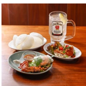
生春巻きとベトナム惣菜のドリンクセット 1,090円 [VIETNAMSE CYCLO/B1] ※平日は 19:00、土日祝は 18:00 までのご提供