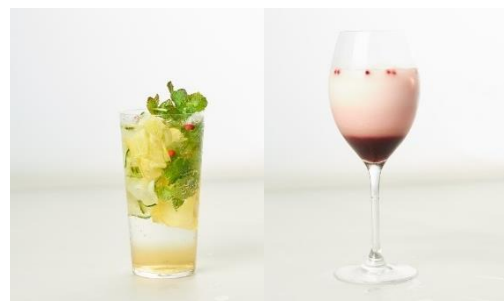
(左)ズッキーニモヒート 1,100円 (右)ピーツラムミルク 1,100円 [REVIVE KITCHEN THREE/2F]