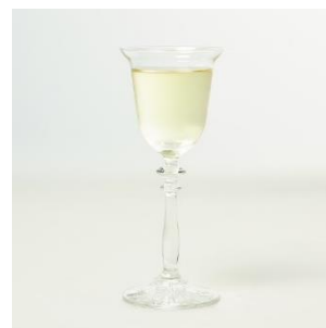
樽生シードル 1,650円 [STAR BAR/3F]