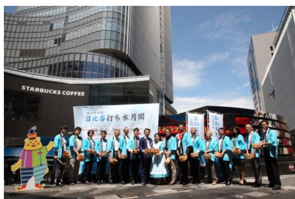
過去の打ち水の様子