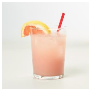
ホエーブリーズ 935円 [GOOD CHEESE GOOD PIZZA/2F]