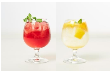
(左)ローズヒップカシスサワー590円 (右)フローズントロピカルサワー690円 [DIYA/2F]

17時～20時限定、ちょっと贅沢なアルコールメニューを楽しめる「HIBIYA SUNSET HOUR」を明日6月24日(金)～実施いたします。”至福の夕飲み”を楽しめる、この夏だけの特別メニューを是非ご堪能下さい。