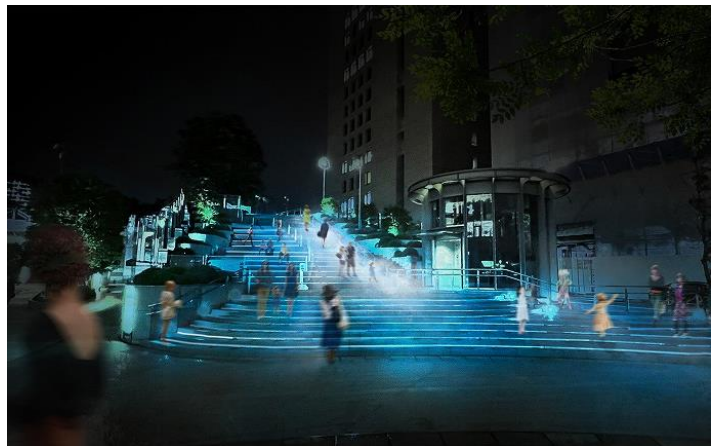
AQUA SCENE イメージ