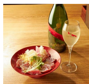
シャンパーニュのママと鮮魚の油しやぶ刺しセット 1,980円 [天ぶら天寅/2F]

※内容は都合により変更となる場合がございますので予めご了承ください。 ※食材等の都合により、1日のご提供数が終了する可能性もございますのでご了承ください。 ※営業時間変更により提供時間が変更になる可能性がございますので、詳細は各店舗にお問い合わせください。 ※価格はすべて税込です。別途サービス料が発生する店舗がございます。 ※新型コロナウイルス感染拡大防止措置に伴い、急な営業時間・メニュー内容の変更・アルコール提供の中止、臨時休業が発生する可能性がございます。 ※お車で越しのお客様及び未成年の方へのアルコール類のご提供は差し控させていただきます。