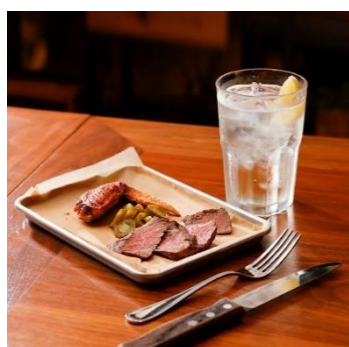
BBQ2 種と選べるドリンクセット 1,090円 [BROOKLYN CITY GRILL/B1] ※19:00 までのご提供