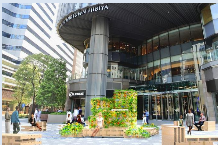
夏を感じる休憩スポットで施設で注文したフードをテイクアウトして堪能するのもおすすめ

広場に設置するファニチャーは貿易などの荷台で使用する「木パレット」のリユース材を使用いたします。