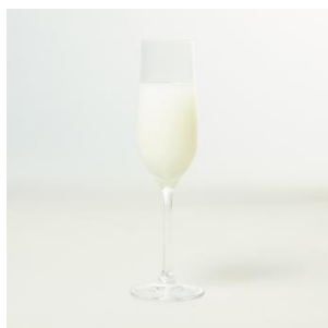
仙亀かるくいっぱい 880円 [三分亭/3F]