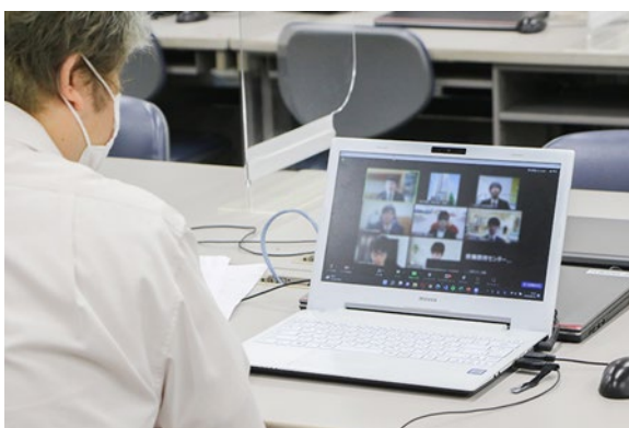
本番さながらのグループ面接