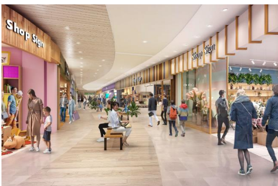
ららぽーと門真(1階)内観 CG

主に 2 階に配される MOP 大阪門真は、約 100 店舗を予定しています。国際ブランドから国内ブランドまで多彩なショップを揃え、ブランドショッピングをより身近にお楽しみいただける空間です。新しい出会いや喜びに満ちた非日常体験をお届けします。