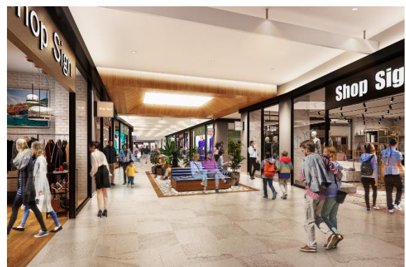
MOP 大阪門真(2階)内観 CG