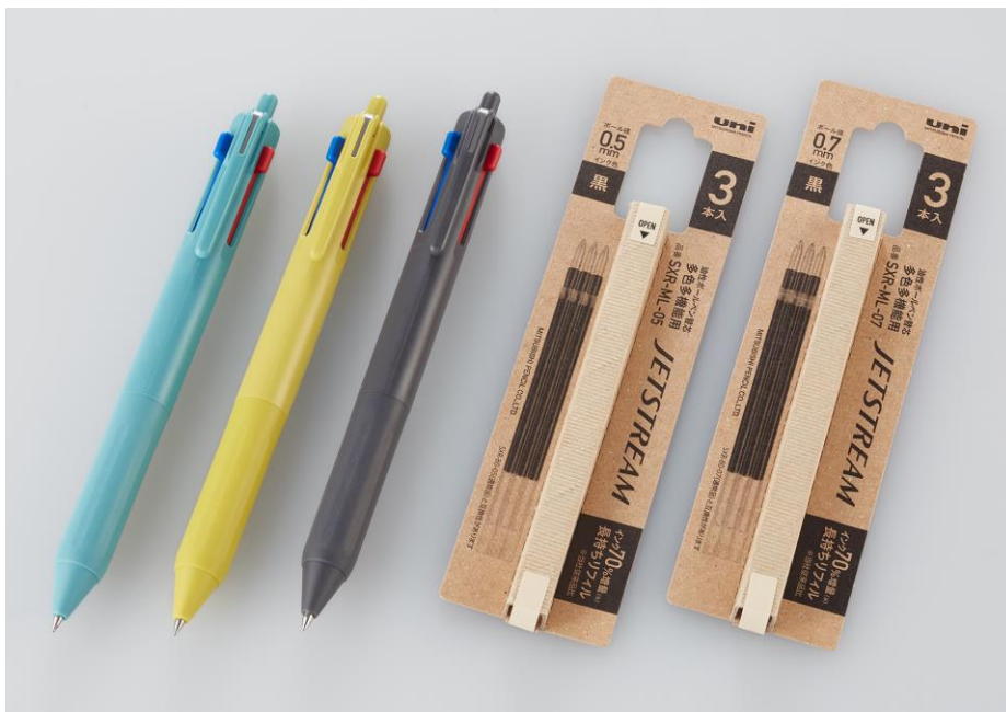
『ジェットストリーム 新3色ボールペン』/『長持ちリフィル（黒）3本パック』

『ジェットストリーム 新3色ボールペン』は、最もよく使われている黒インクをより使いやすく進化させた3色ボールペンです。今回新発売する限定軸には、新3色ボールペンをより気軽にお使いいただけるよう、日常に溶け込むような色を採用しました。ナチュラルで飾らない色合いは、さまざまな服装やインテリアとマッチするため、飽きることなくお使いいただけます。『長持ちリフィル（黒）3本パック』は、よく使用する黒インクを複数ストックできる紙製パッケージとなっています。