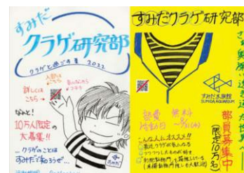
部員募集ポスターイメージ

部員募集の大型広告が「新宿」駅に登場します。部活動誘いの立て看板のような、どこか懐かしい手書き感と熱意のこもったグラフィックに仕上げました。実際に当館のスタッフが描いたポスターも採用し、「新宿」駅の東口と西口を結ぶ通路に立体形状の9種類の部員勧誘ポスターが並びます。