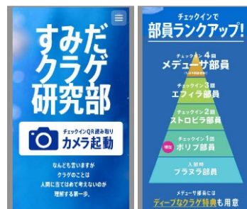
部員専用ウェブサイトイメージ