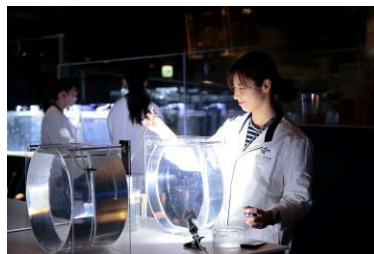
5階アクアベース「ラボ」

本企画では、“クラゲを人間の枠組みで考えない”をコンセプトに、飼育スタッフを先輩部員、お客さまを新入部員とした「すみだクラゲ研究部」を結成します。種類によって異なる特長を持ち、いまだ解明されていないことの多いクラゲを、“鑑賞”のスタイルではなく、じっくりと観察することで、クラゲの奥深い魅力を体感いただけます。