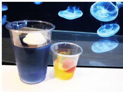
早変わり！ クラゲのライムミントティー