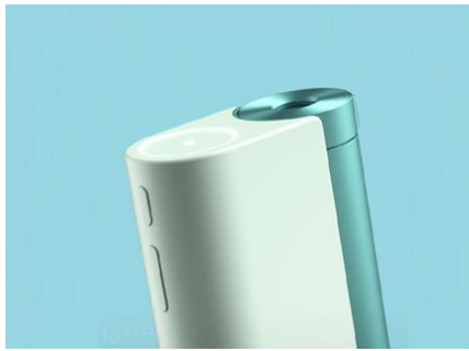
▲イメージ (新LEDインジケター)