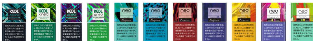
glo™ hyper 用たばこスティック (2022年7月時点の全販売銘柄)