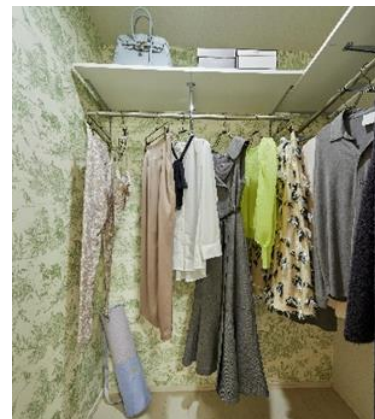
【ウォークインクローゼット】