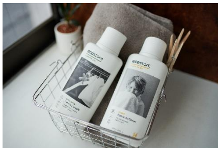
【洗面所アメニティ「ecostore(エコストア)」商品】

人と地球のよりよい未来のために原材料や製造工程にこだわり、環境に配慮されたニュージーランド発ナチュラルデイリーケアブランド「ecostore(エコストア)」の商品を洗面所に、フェアトレードの実践・自社農園での生産・動物実験の不実施等にこだわるナチュラル&オーガニックのアイテムを取り扱う「Cosme Kitchen(コスメキッチン)」や「Biople(ビープル)」の商品をキッチンにセットしています。