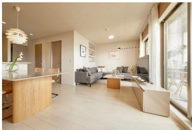
【リビング・ダイニング】