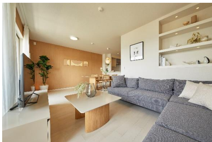
【リビング・ダイニング】