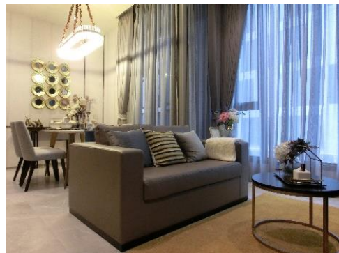
モデルルーム内観(リビングルーム)