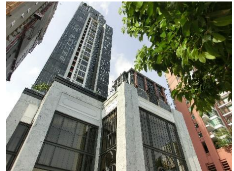
HYDE Heritage Thonglor 外観

住友林業株式会社(社長:光吉 敏郎 本社:東京都千代田区)がタイ・バンコク中心部で現地企業と共同開発していた高級分譲マンション「HYDE Heritage Thonglor」が竣工しました。地上 45 階・地下 2 階建て、総戸数 311 戸で、日本人も多く住むバンコク中心部の高級住宅地「トンロー地区」に位置しています。駅徒歩 5 分と交通利便性が良く、40 階の 360 度ビューのスカイプールをはじめ充実した共用空間、生活の質を高めるコンシェルジュサービスを兼ね備えています。住友林業の設計提案により高級感あるデザインと生活動線を意識した機能的な間取りが実現しました。