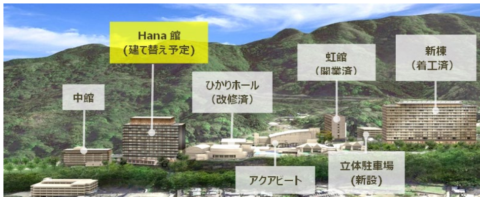
大規模リニューアル完了後のイメージ

2021年12月1日に閉館した「Hana館」の建て替えのほか、計3棟の客室棟を新築し、2025年に全面リニューアル工事完了を目指しています。