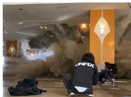
「ロビーで爆破シーン撮影の様子」

別府短編映画制作プロジェクトの第二弾作。『長髪大怪獣ゲハラ』で商業監督デビューし、ウルトラマンシリーズで三作品でメイン監督を務めた田口 清隆氏が監督を務め、主演は『ウルトラマンオーブ』『劇場版ウルトラマンジード』にてオーブの宿敵ジャグラスジャグラ役を演じ、人気を博した俳優の青柳 尊哉氏が務めます。映画制作プロジェクトが掲げる<30分以内の短編><撮影はオール別府ロケ><別府市民と力を合わせて作品作り>をベース