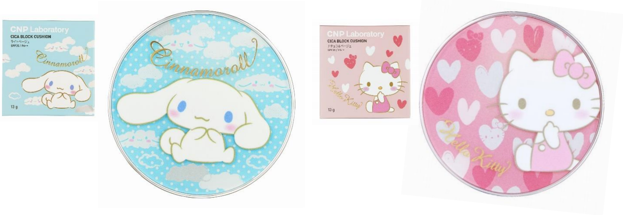
左：パッケージ 右：本体