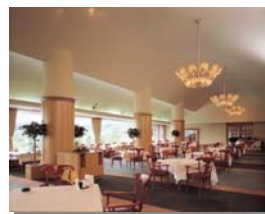
上段左：クラブハウス 中：エントランス 右：レストラン 下段左：OUT No.2 中：OUT No.6 右：練習場