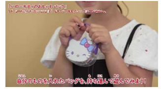
<おもちゃの遊び方紹介動画（一部）>