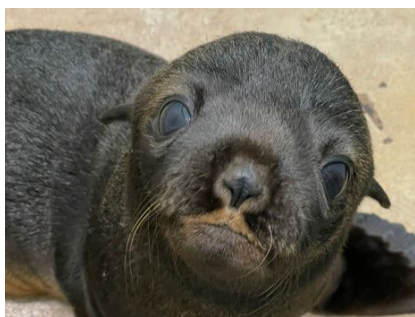
ミナミアメリカオットセイの赤ちゃん（24日齢）

すみだ水族館（所在地：東京都墨田区、館長：毛塚 広治）は、2022年6月8日（水）にミナミアメリカオットセイの赤ちゃんが誕生しましたのでお知らせします。短期ブリーディングローン*によるミナミアメリカオットセイの赤ちゃんの誕生は国内初です。