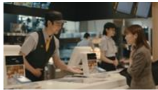
妻夫木さん：ポテナゲおトクですよ