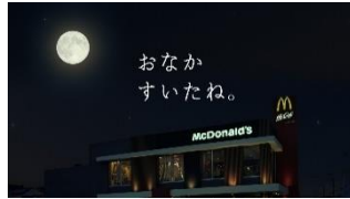
ナレーション：家族にもおすすめ。おトクなポテナゲ