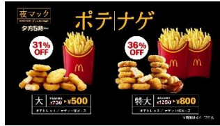
妻夫木さん：ほら、ポテナゲ