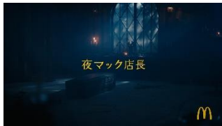
妻夫木さん：あ〜、よく寝た