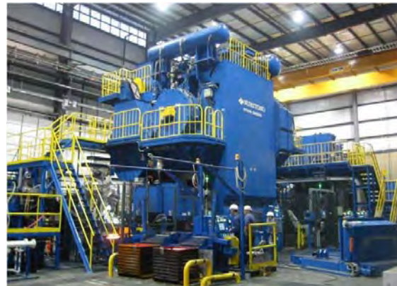
第3鍛造プレスライン (6,000 T 高速プレス)