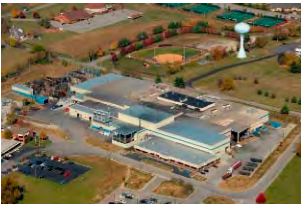
インターナショナル・クランクシャフト社 全景

新日鐵住金のクランクシャフト事業は、日本、米国、中国、インドの世界4拠点体制で事業を展開しており、現在世界で年間1100万本体制、シェア10%を確立しています。今後も伸びゆく自動車市場を捕捉し、技術開発力・コスト競争力を高め、グローバルな事業展開を加速してまいります。