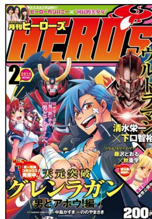
月刊『ヒーローズ』2月号

※2014年2月号では、『アサシン ichiyo』、『海傑エルマロ』、 『ドラゴンエフェクト 坂本龍馬異聞』は休載させていただきます。