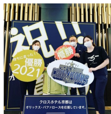
昨年リーグ優勝時のバックボードパネル (クロスホテル京都)