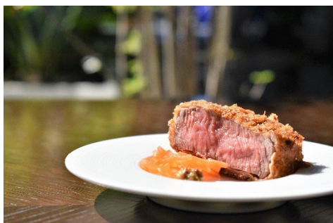
牛カツメニュー（イメージ）

※提供メニュー、提供方法は各施設で異なります。詳細は、各施設までお問い合わせください。