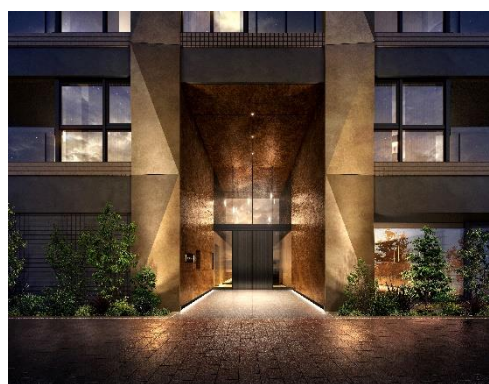
エントランスアプローチ（イメージ）

本物件は、東京メトロ丸ノ内線・有楽町線・副都心線「池袋」駅徒歩7分、JR山手線「池袋」駅徒歩10分と、全8路線が集まるビッグターミナル「池袋」駅の徒歩圏内に位置します。「東武百貨店 池袋店」や駅直結の「Esola 池袋」などの大型商業施設がそろう駅周辺エリアは、「特定都市再生緊急整備地域 ※1 」として再開発が進み、利便性はもちろん、公園、劇場、カフェなど、文化芸術・地域のにぎわい・情報発信拠点として整備されています。