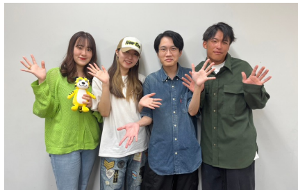
トリックアート企画メンバー