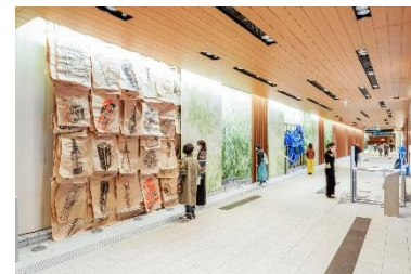
▲ デザインコンペでは、東京ミッドタウンの季節ごとのイベントでのデザイン起用や、受賞作品の商品化サポートを実施。(写真左・中央) アートコンペでは東京ミッドタウンでの新作発表やワークショップ開催など機会創出の強化を行っています。(写真右)