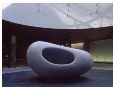
▲ 意心帰(安田 侃)