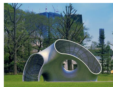
▲ フラグメント No.5 (フロリアン・クラール)