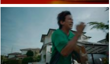
岡田さん: あの子と次に