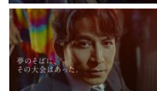
岡田さん: 歴代のワールドカップを イメージした 時をかけるバーガー誕生