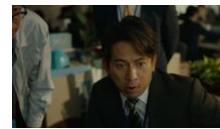
岡田さん: 熱狂する味がした