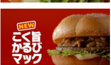
NA: こく旨かるびマック