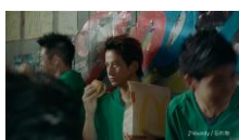
岡田さん: 年に連れて行った