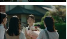
岡田さん: 会ったのは