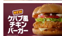
NA: ケバブ風チキンバーガー