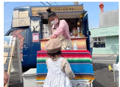
キッチンカー出店の様子