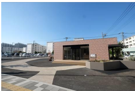
リニューアル後外観

京急電鉄では，2018年に横浜市と連携協定を締結し，「富岡・能見台エリア」「金沢区心部（金沢文庫駅～金沢八景駅間）」を重点地区として，持続可能なまちづくりに向けて取り組んでおります。本取組みも，横浜市南部地域のまちづくりの一環です。詳細は別紙のとおりです。