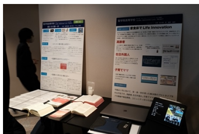
ポスターセッション