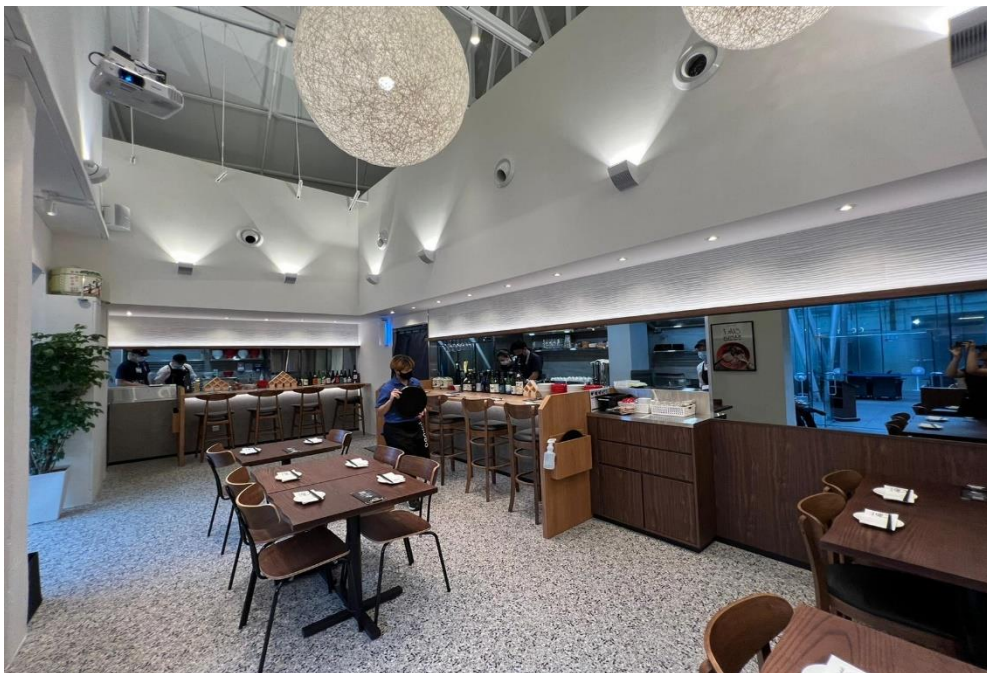
シンガポール「IPPUDO Clarke Quay」店内

博多発祥の世界に展開するラーメン店「一風堂」の海外直営店が2022年9月～10月にかけて3店舗オープンしました。9月1日にシンガポール「IPPUDO Clarke Quay」、10月14日に台湾「IPPUDO 林口三井」、10月22日にオーストラリア「IPPUDO World Square」が続々とオープンし、今後更に回復を見込むエリアに一風堂の出店を計画中です。