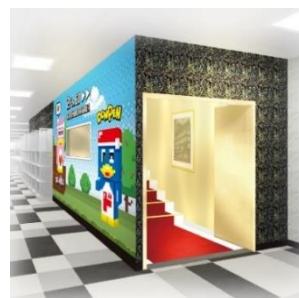
▲店舗コンセプトの「ギラギラな非日常」を感じられる派手な階段▲

食品は流行りのグミや輸入食品コーナーの品ぞろえを充実させるほか、お酒は家飲みから業務用の大容量品まで取り扱い、ワクワク・ドキドキと利便性を兼ね備えた品ぞろえです。さらに家電製品は、調理家電や理美容家電等の「持ち帰り家電」をメインに展開します。コンパクトな店舗のため、お買い回りがしやすい売り場構成です。