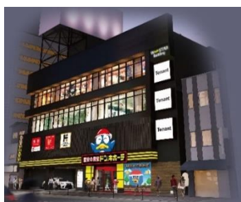
▲ドン・キホーテ京橋店 店舗外観イメージ▲

株式会社ドン・キホーテ(本社:東京都目黒区、代表取締役社長:吉田直樹)は、2022年11月18日(金)に、大阪市都島区に「ドン・キホーテ京橋店」をオープンします。大阪市内では16店舗目*です。*ドン・キホーテ、MEGAドン・キホーテ、エキドンキ業態合わせた店舗数