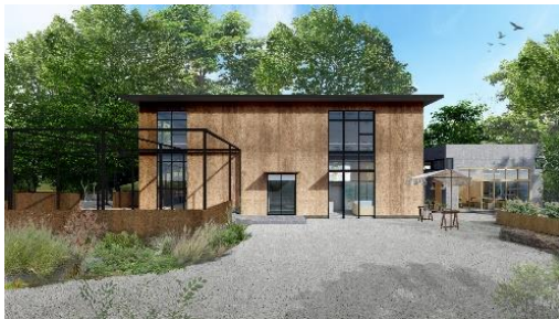
収益施設の外観(イメージ)

施設内のカフェは株式会社オペレーションファクトリーが運営し、地域食材を使ったメニュー開発や公園の自然を楽しみながら飲食できる空間を提供します。株式会社アーバンリサーチは施設内で販売する公園グッズの企画商品化や菜園をプロデュースし、公園の利便性向上と賑わい創出を推進します。フクシマガリレイ株式会社はコミュニティスペース内に設置するキッチンの監修と食に関するワークショップなどを行います。公園施設の設計は株式会社乃村工藝社と株式会社 MuFF が担当し、自然を活かし、公園と一体感のある空間づくりを行います。