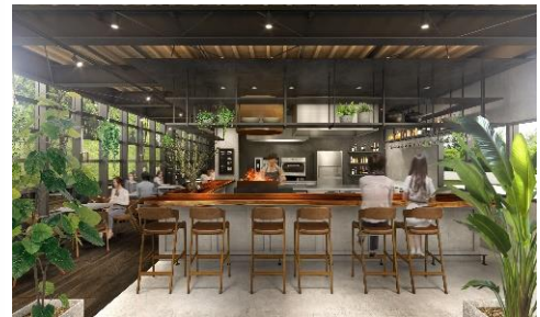
カフェ内観(イメージ)