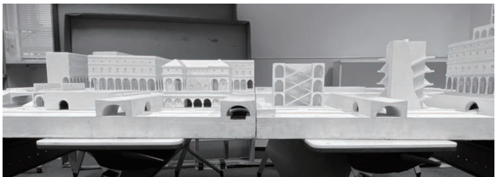
レオナルド・ダ・ヴィンチ理想都市模型 正面より